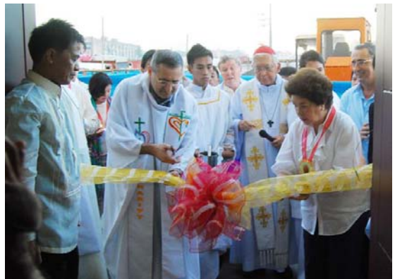
Il Padre Generale, con il Cardinale Gaudenzio Rosales al taglio del nastro per l'inaugurazione del centro giovanile

parrocchia di San Paolo Apostolo nel potere avere finalmente un posto sano e sicuro per incontrarsi, crescere nell'amicizia e rispetto. Un posto dove si cercherà di formare in modo integrale questa nuova generazione che fino adesso ha avuto poco dalla vita. Ci sarà non solo formazione umana e spirituale, ma anche culturale e sportiva, professionale ed intellettuale.