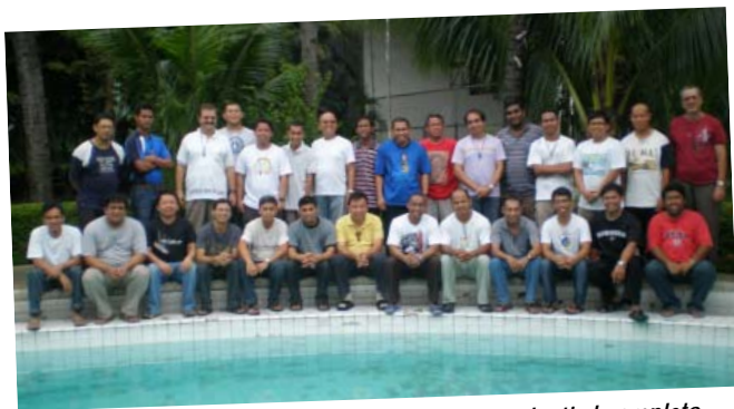
Padri, studenti di teologia, filosofia, novizi, postulanti al completo.