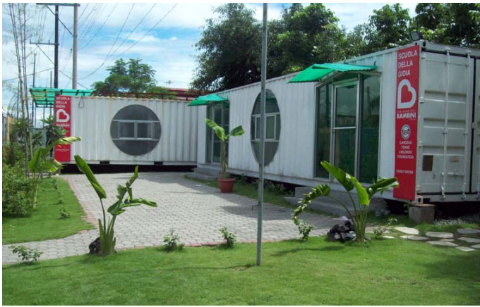
Il complesso, un pó caratteristico, in due container, della "Scuola della Gioia".

Settembre) e finora non abbiamo avuto defezioni. E sì, è molto facile che più di qualcuno non si presenti più a scuola. Assenze avvallate dai genitori stessi, alcuni dei quali non riescono a capire l'importanza di una educazione sotto tutti i punti di vista. D'altronde fanno una certa compassione. La maggioranza di essi, nel loro curriculum di giovane vita, non hanno nemmeno terminato la scuola elementare. Pochi la scuola media, e nulla di più. Quindi è