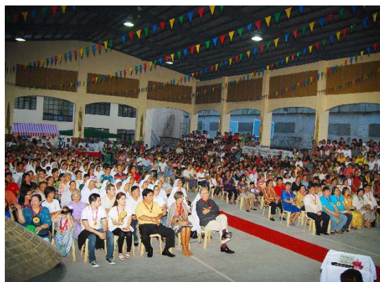
La comunità parrocchiale durante la concelebrazione della messa, all'interno della palestra.