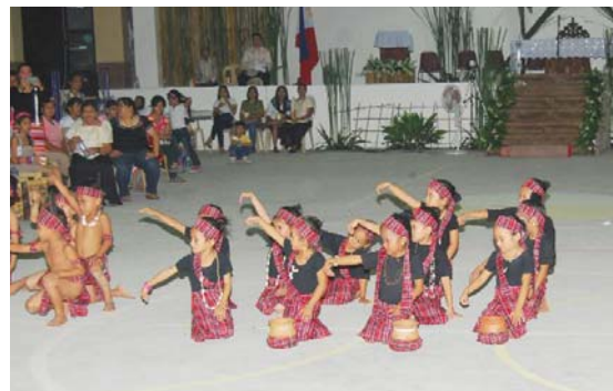
I bambini dell'asilo parrocchiale, mentre si esibiscono nei costumi della tribù filippina degli Igoroto, durante altri numeri, durante l'inaugurazione del nuovo complesso parrocchiale.