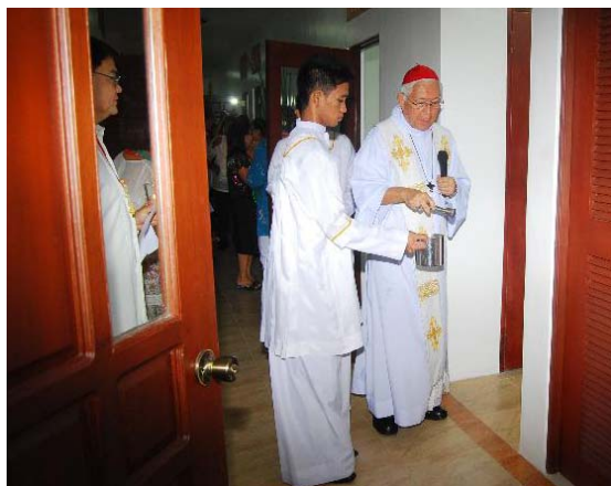
Il Cardinale Rosales si appresta a benedire i locali del centro giovanile.