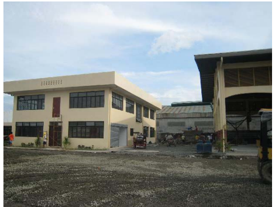
Il nuovo centro giovanile, Oratorio, della Parrocchia di San Pablo.

Quello che due anni fa sembrava un sogno impossibile è diventato una realtà. Immaginabile la gioia e l'orgoglio della gioventù e della gente della